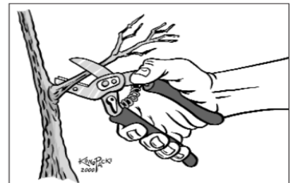
Herramienta bien diseñada: Los mangos son largos. El muelle o resorte abre automáticamente la herramienta. Los mangos están cubiertos de goma o plástico.