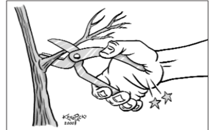
Herramienta mal diseñada: El mango hace presión en la base de la palma de la mano y requiere que el usuario la abra después de cada corte (no tiene muelle).

Para acceder las herramientas para el hogar, agricultura y jardín contacte a CalAgrAbility o Ability Tools en California.